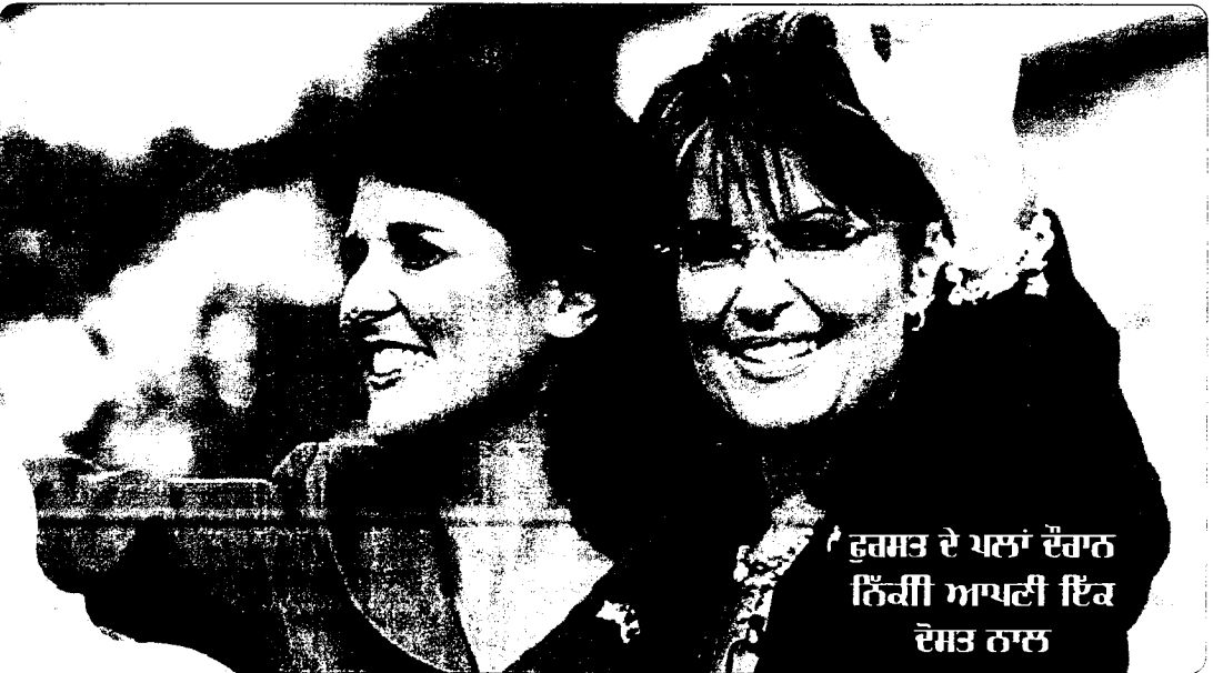
ਫੁਰਸਤ ਦੇ ਪਲਾਂ ਦੌਰਾਨ ਨਿੱਕੀ ਆਪਣੀ ਇੱਕ ਦੋਸਤ ਨਾਲ

(ਗਿੱਲ - ਸ਼ਾਰਲਟ (ਅਮਰੀਕਾ), 001-704-257-6693)