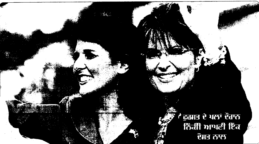
ਫੁਰਸਤ ਦੇ ਪਲਾਂ ਦੌਰਾਨ ਨਿੱਕੀ ਆਪਣੀ ਇਕ ਦੋਸਤ ਨਾਲ

(ਗਿੱਲ- ਸ਼ਾਰਲਟ (ਅਮਰੀਕਾ), 001-704-257-6693)