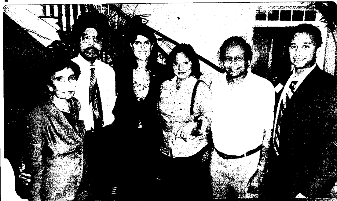
ਅਮਰੀਕਾ ਵਿਖੇ ਆਪਣੇ ਪਰਿਵਾਰ ਨਾਲ ਨਿੱਕੀ ਹੈਲੇ।

ਨਿੱਕੀ ਹੈਲੇ 42 ਸਾਲਾਂ ਦੀ ਅਮਰੀਕਾ ਦੀ ਸਭ ਤੋਂ ਜਵਾਨ, ਪਹਿਲੀ ਔਰਤ ਤੇ ਦੁਬਾਰਾ ਜਿੱਤੀ ਇੱਕੋ-ਇੱਕ ਗਵਰਨਰ ਬਣੀ ਹੈ। ਉਹ ਰਿਪਬਲੀਕਨ ਪਾਰਟੀ ਦੀ ਨੇਤਾ ਤੇ ਲੋਕਾਂ ਤੋਂ ਸਭ ਤੋਂ ਵੱਧ ਇਲੈਕਸ਼ਨ ਫੰਡ ਪ੍ਰਾਪਤ ਵੀ ਕਰ ਚੁੱਕੀ ਹੈ। ਹਾਲਾਂਕਿ ਜਦੋਂ ਉਹ ਵਿਦਿਆਰਥਣ ਸੀ ਤਾਂ ਉਸਨੇ ਰਾਜਨੀਤੀ ਵਿੱਚ ਤਾਂ ਆਉਣ